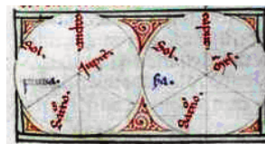
Dos figuras del Capítulo 48 del Libro de las Cruces, significadoras de clima favorable y, por ello, de abundancia de alimentos y precios baratos

Si de Segovia pasamos a Salamanca, encontramos una figura científica importante, Abraham Zacuto, judío de finales del siglo XV, catedrático en la Universidad de esta