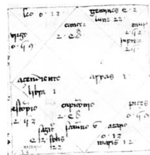
Tema de juicio meteorológico del Capítulo en saber de las lluvias