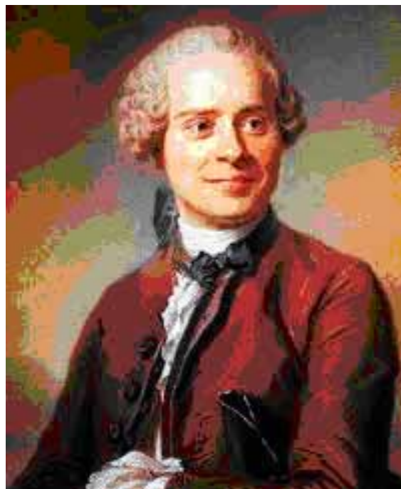
Jean Le Rond D’Alembert