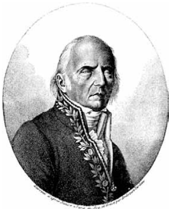
Jean-Baptiste Pierre Antoine de Monet, caballero de Lamarck.

Aún puso más énfasis en la interpretación lunar de los registros meteorológicos Jean-Baptiste Pierre Antoine de Monet, caballero de Lamarck. Más conocido en el mundo de las Ciencias Naturales con este nombre por ser uno de los mejores botánicos y zoólogos de su tiempo, además de uno de los precursores de la teoría de la evolución, es casi ignorado o pasado por alto en cambio el enorme esfuerzo y dedicación que puso en materia meteorológica.